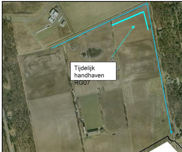
Figuur 2. Globale ligging RG07

In het plangebied, met name gelegen binnen het cluster Oost en ten dele in de ecologische zone ten zuiden van dit cluster, ligt ook een blusvijver van defensie. Deze is al geruime tijd buiten werking en deels gedempt. Zie figuur 3.