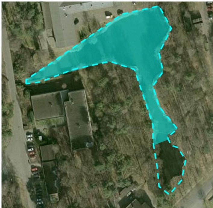
Figuur 3. Blusvijver

In het plangebied, met name gelegen binnen het cluster Oost en ten dele in de ecologische zone ten zuiden van dit cluster, ligt ook een blusvijver van defensie. Deze is al geruime tijd buiten werking en deels gedempt. Zie figuur 3.