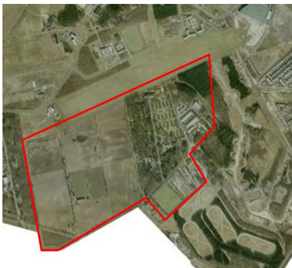
Figuur 1. Luchtfoto plangebied Park Forum, situatie 2003

Deze waterparagraaf heeft betrekking op het gehele gebied van Park Forum, dus zowel het cluster west als ook de clusters oost en zuid. In figuur 1 staat het plangebied Park Forum globaal weergegeven (bron: luchtfoto 2003). Deze waterparagraaf is besproken met het waterschap de Dommel. In paragraaf 6.4 staan hiervan de resultaten.