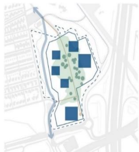
Sliffertsestraat via westen

De politie heeft aangegeven dat handhaven van de Sliffertsestraat op de huidige locatie niet mogelijk is, omdat het complex als geheel afgesloten moet kunnen worden. Daarom wordt de Sliffertsestraat verlegd naar de buitenzijde van het terrein. Of de weg verlegd wordt naar de westzijde (parallel aan de Nieuwe Sliffertsestraat) of de oostzijde (parallel aan de N2 en het kanaal), wordt pas besloten nadat de buurt breed geconsulteerd is hierover. Aan de functie van de Sliffertsestraat en de Nieuwe Sliffertsestraat verandert niets.